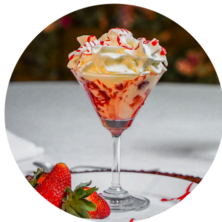
Verrine de Frutas