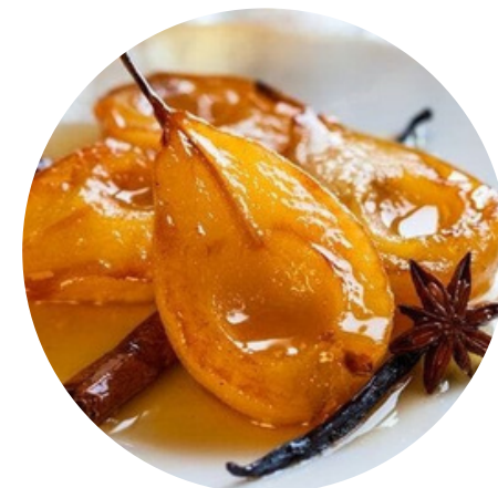
Pêra Caramelizada com Canela