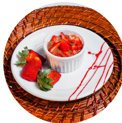
Ganache de Chocolate Com Morango