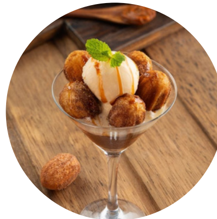
Mini Churros Na Tacinha Com Sorvete