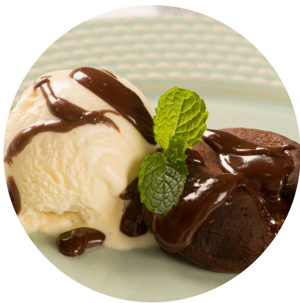
Petit-Gateau Com Sorvete de Creme e Calda de Chocolate